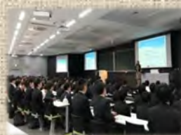
「身だしなみ」セミナー（大学内）