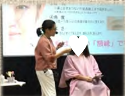
ヘアメイクセミナー

証明写真は、就活サイトやイベントで「身だしなみ講座」を担当する私たちにお任せください！