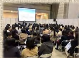
就活イベントセミナー